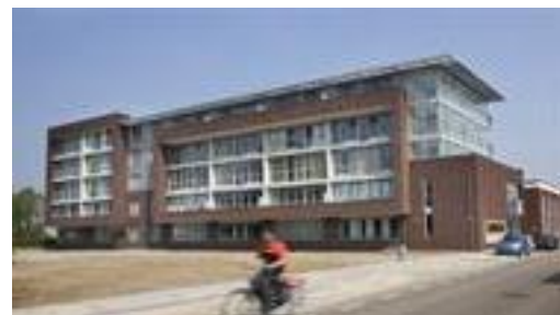
Park Viverre aan de Mierloseweg is voorzien van een digitaal Telelock slot bij de toegangsdeur.

Omdat zorgorganisaties Savant en de Zorgboog hiervan dagelijks de gemakken en ongemakken ervaren, dachten zij mee over een nieuw toegangssysteem.